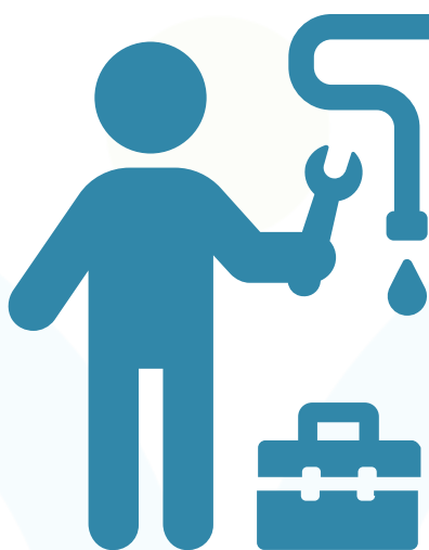
Les pipelines qui fuient

dans le secteur de la gestion et des conseils d'administration de 191 entreprises ont conclu que ni les niveaux d'éducation avancés des femmes, ni leur participation croissante au marché du travail n'a produit une augmentation correspondante de l'accès des femmes aux postes de décision, même pour des femmes hautement qualifiées.