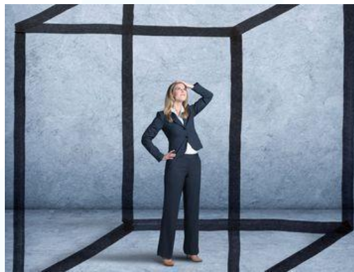
Mur de verre

l'offre publique de soins aux enfants et aux personnes dépendantes. Selon (OIT, 2018), certaines entreprises pensent que l'embauche et la promotion des femmes sont plus élevées que ceux des hommes, car ces dernières finiront par démissionner pour des raisons familiales et l'investissement de l'entreprise dans leur formation sera perdu. Toujours d'après ce rapport, les rôles et les stéréotypes traditionnels liés au genre d'une culture donnée, influencent grandement la perception de l'égalité et de la diversité des sexes au sein des entreprises.